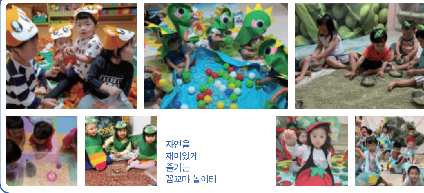
자연을 재미있게 즐기는 꿈꼬마 놀이터